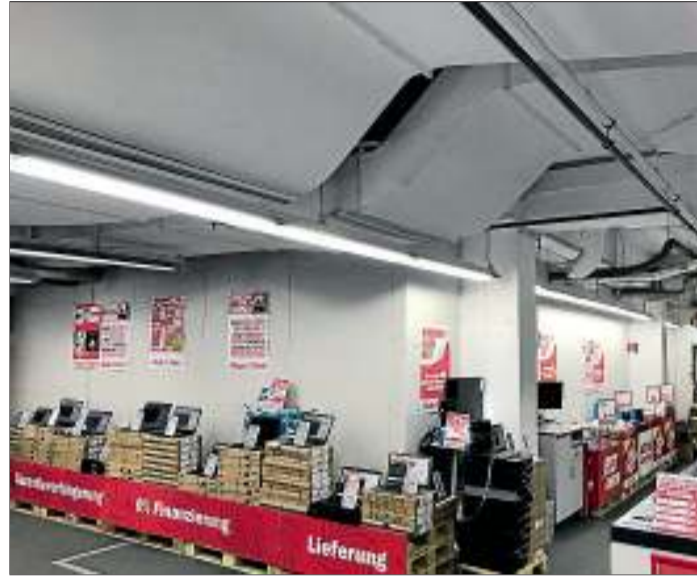
Die Treppe ins Obergeschoss wird hinter der Wand erneuert, der Fahrstuhl führt nach oben zu Spielen, Filmen, CDs und Musik.

„Unsere Architekten haben bei der Planung an alles gedacht, um