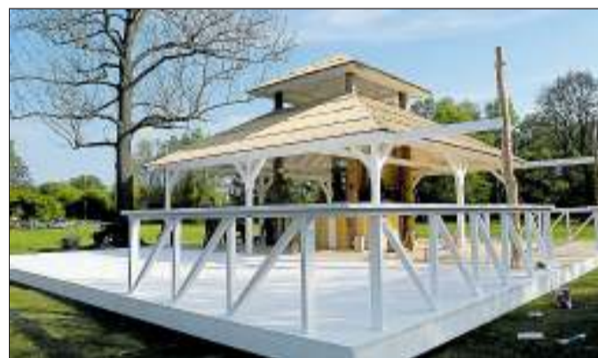
Seit heute gibt es eine neue Strandbar im Kennelbad. Ein Highlight des Pier38 ist die große Beach Bar, die ihre Vorbilder unter anderem in Thailand hat.

Apropos Beachclub: Was macht eigentlich das Sonnendeck Süd auf dem Dach des Parkhauses am Bankplatz? Wie die Betreiber auf ihren Facebook-Seiten mitteilen, sei es derzeit noch aufgrund von Renovierungsarbeiten geschlossen, soll aber „bald wieder eröffnet werden“, so das Versprechen.