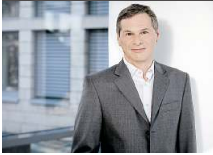
Der Journalist Georg Mascolo kommt am 23. Mai zum Leserforum in das BZV Medienhaus.

Journalisten im Laufe der Jahrzehnte verändert?