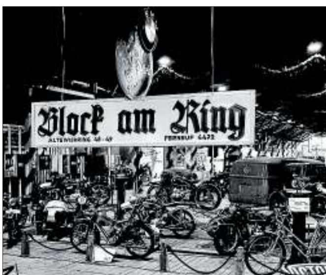
Der Beginn einer Erfolgsgeschichte: August Block startete 1896 mit einem Fahrradhandel am Altwiekering.