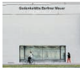
Die Gedenkstätte Berliner Mauer.

Die Plätze sind jedes Mal schnell ausgebucht, aber mit ein bisschen Glück können drei Leser der NB inklusive Begleitung mit dabei sein.