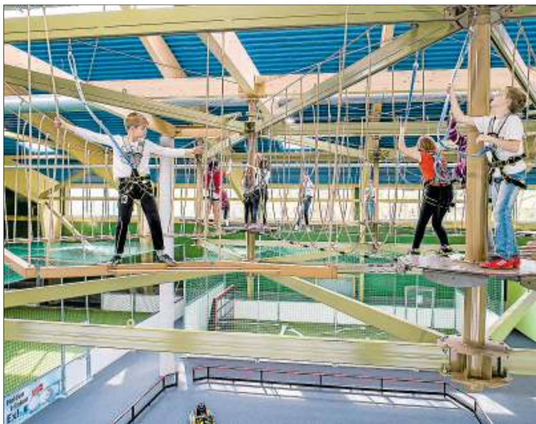
Der moderne Hochseilgarten, darunter Soccerfeld (links), Torwand (hinten) und Miniauto-Bahn (vorne).

Die Erweiterung der wetterunabhängigen Erlebniswelt in Salzemmendorf umfasst drei Schwarzlicht-Minibowling-Bahnen, eine Schwarzlicht-Minigolf-Anlage, eine elektronische Torwand, ein Soccerfeld, einen Hochseilgarten und sieben neue Geburtstagsräume. Die Schwarzlicht-Bereiche wurden vom Grafitti-Künstler BeNeR1 und seinem Team gestaltet. Der Sprayer aus Hannover entwickelte ebenfalls ein individuelles Design für jeden der sieben neuen Geburtstagsräume. Diese können den gesamten Tag gemietet werden und finden bei den Besuchern bereits hohen Anklang. „Ein Kindergeburtstag