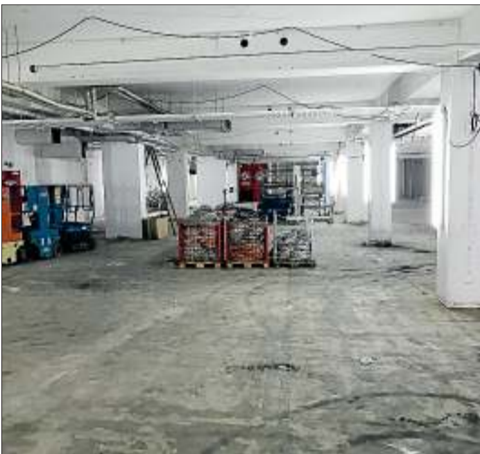
Hinter den Kulissen wird alles erneuert: Elektrik, Lüftung und Heizung, Bodenbeläge, Beleuchtung und IT-Infrastruktur.