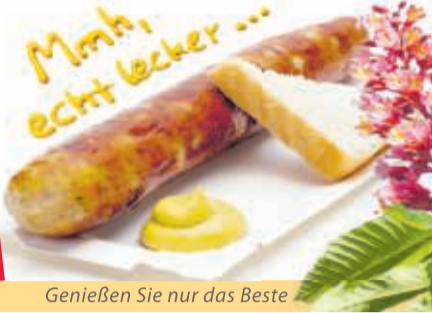
Genießen Sie nur das Beste

Unsere Spezialitäten: Bratwurst und Krakauer vom Grill sowie heißer Backschinken im Brötchen.