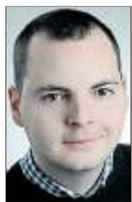
Autor Jonas Dräger

Um jeden Zähler geht es auch für Würzburg, Aue und 1860 München, die jeweils zu Hause auf Punktejagd gehen können. Würzburg trifft auf die Sandhäuser, die ebenfalls noch