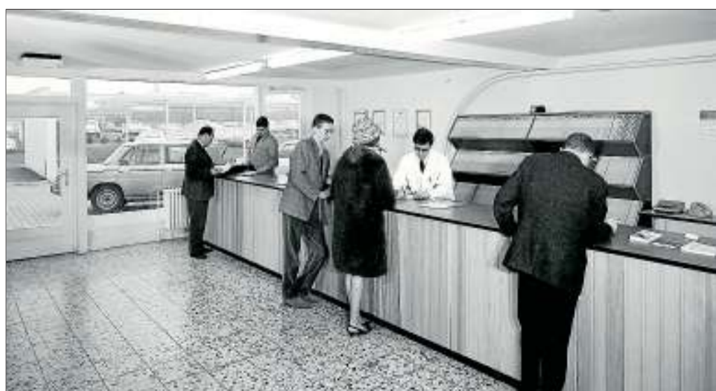
Modern, schick und zeitgemäß: 1967 zog das Unternehmen in das neue „Mutterhaus“ an der Gifhorner Straße.

Veranstaltungsort ist das TZH Braunschweig, Hamburger Straße 234, 38114 Braunschweig. Information und Anmeldung bei Nadine Sante, Telefon 1 20 15 08, sante@hwk-bls.de .