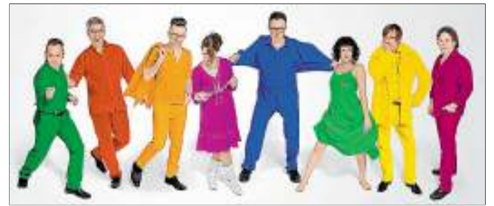
Eine Liebe teilen diese Braunschweiger Musiker: Die Beatles. oh

ersten Hälfte der Show sein. Der Soundtrack zum skurrilen Fern- sehfilm der Fab Four hat es in sich. Unter anderem findet sich darauf das einzige Instrumental- stück, dass die Beatles je veröf- fentlichten. Und zum Abschied heißt es: „Let it be!“