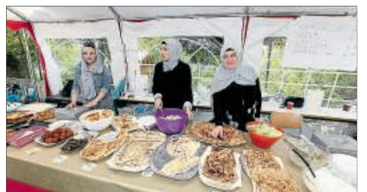
Miteinander reden und lecker essen: Das Kermes-Fest will Nachbarn zusammenbringen.

Noch bis morgen feiert die DITIB-Gemeinde ihr Frühlingsfest