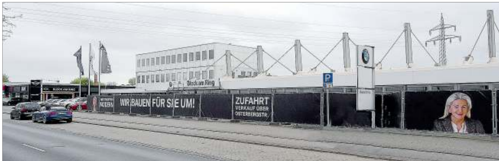
Hier tut sich etwas: Das Block-Mutterhaus an der Gifhorner Straße feiert in diesem Jahr 60. Geburtstag. Aktuell ist es von einem Bauzaun umgeben. Ein komplett neuer Verkaufsraum entsteht.